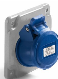
Ref. / Item 23270